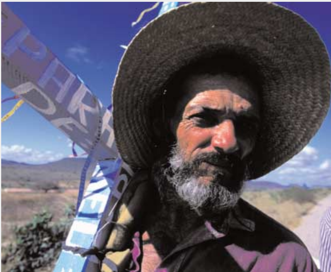
In pellegrinaggio a Pernambuco, in Brasile (2001).

no saputo conservare una dignità individuale molto forte.