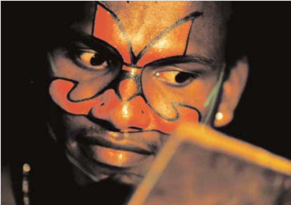
Make-up per le danze Katakali, a Cochin nel Kerala (2001).

A destra: Venditore di medicine e miracoli, a Marrakech (2000).