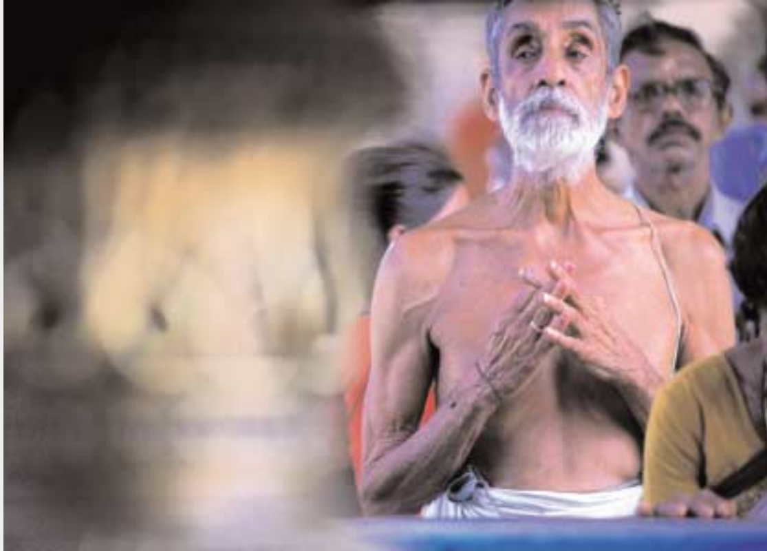
Nel tempio di Kerala, in India (2001).